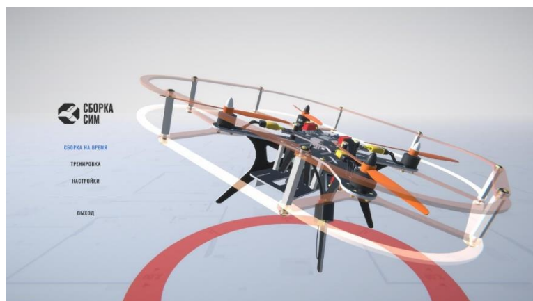
Рисунок 1 – Вариант интерфейса стартовой страницы специализированного программного обеспечения СБОРКА СИМ,