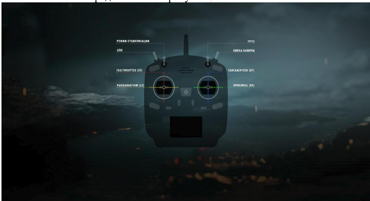
Рисунок 3 – Схема управления БВС в симуляторе с использованием пульта.

Схема управления БВС в симуляторе с использованием пульта Radoimaster TX12 представлена на рисунке 3.