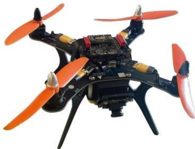
Рисунок 3 – БВС «Геоскан Пионер»